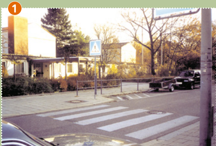
Übergang vor der Schule